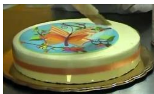
Декогель "Нейтральный" ведро 6 кг