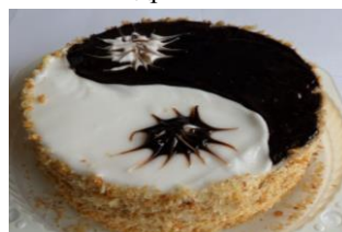
Декогель "Белый" ведро 6 кг