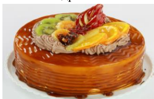
Декогель "Карамельный" ведро 6 кг